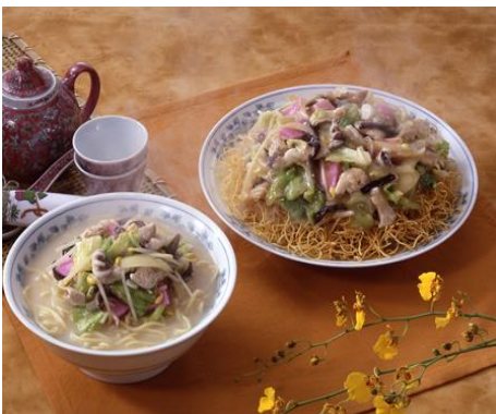
▼什锦汤面·什锦炒面