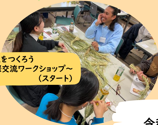
しめ縄をつくろう ～国際交流ワークショップ～ (スタート)