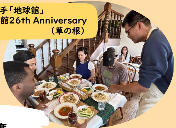
東山手「地球館」 開館26th Anniversary (草の根)