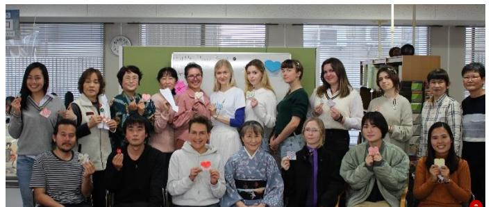
Cầm tác phẩm hoàn thành lên để chụp ảnh kỷ niệm!