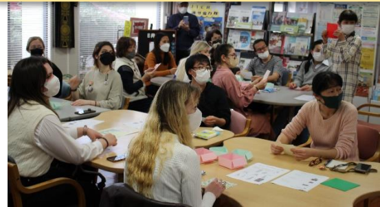
Học viên chăm chú lắng nghe giáo viên giải thích