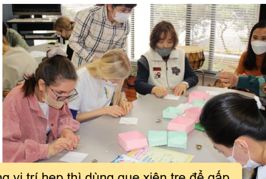
Những vị trí hợp thì dùng que xiên tre để gấp