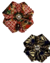
Các bạn thấy các hình gấp này có giống nhau không?