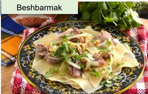
Món ăn quốc dân dùng thịt cừu của Kazakhstan