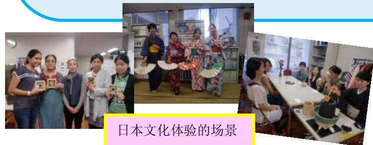
日本文化体验的场景

在长崎的生活，到处都是第一次。长崎是一个非常好的地方，也是我的第二故乡。我在这里七个月的生活，结识了很多热情的人，感觉很幸福。这将是我一生的财富。