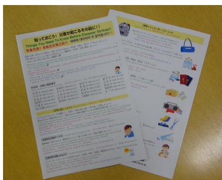
《有备无患！准备在灾难之前!!》